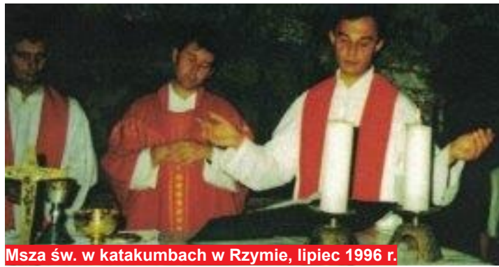
Msza św. w katakumbach w Rzymie, lipiec 1996 r.