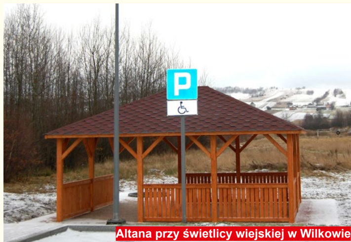
Altana przy świetlicy wiejskiej w Wilkowie

w miejscowościach Podgórze –Bodzentyn (rondo) – Dąbrowa oraz we Wzdole. Gmina ze swojej strony wykonała wszelkie zobowiązania wobec Urzędu Marszałkowskiego związane z tą inwestycją.