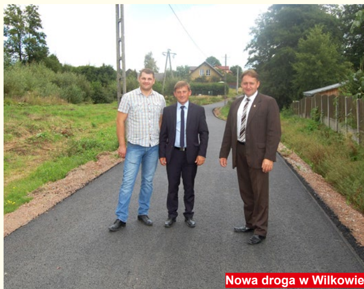
Nowa droga w Wilkowie

- W zdecydowany sposób poprawiono działalność placu targowego oraz przeniesiono małą targowicę w pobliże kościoła w Bodzentynie.