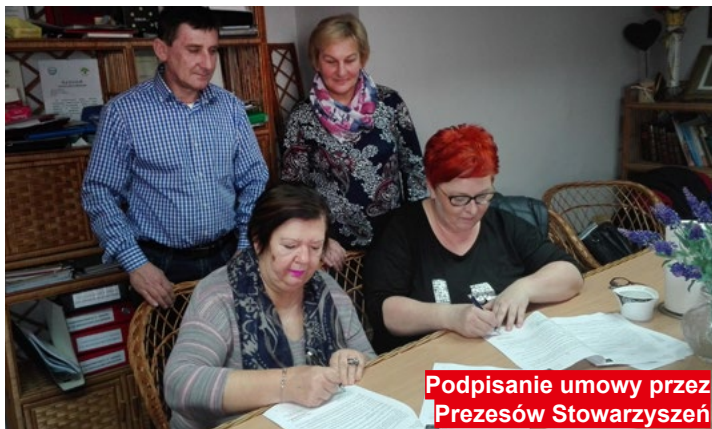
Podpisanie umowy przez Prezesów Stowarzyszeń