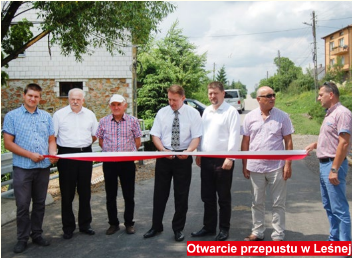
Otwarcie przepustu w Leśnej

Zamówiono dodatkowe elementy placu zabaw przy szkole podstawowej w Psarach Starej Wsi. Ponadto ze środków budżetu gminy doposażono samochód strażacki, wykonano instalację grzewczą oraz zakupiono materiały, z których wykonano elewację na budynku OSP.