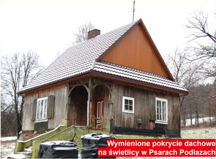
Wymienione pokrycie dachowe na świetlicy w Psarach Podłazach

Z perspektywy czasu żałuję, że nie wpisaliśmy do projektu więcej odcinków dróg niż tych 16 zgłoszonych. Pewne osoby namawiały mnie abym zrezygnował z takiej ilości rekomendowanych o dofinansowanie dróg z uwagi na zbyt małą ilość środków finansowych zabezpieczonych w naborze. Jednak wszystkie nasze propozycje zostały zakwalifikowane.