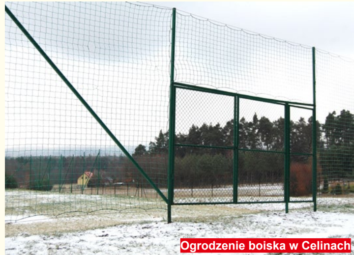
Ogrodzenie boiska w Celinach

Jeśli chodzi o działania, z ostatniego okresu to chyba jestem zadowolony z pozyskanych środków na remonty dróg.