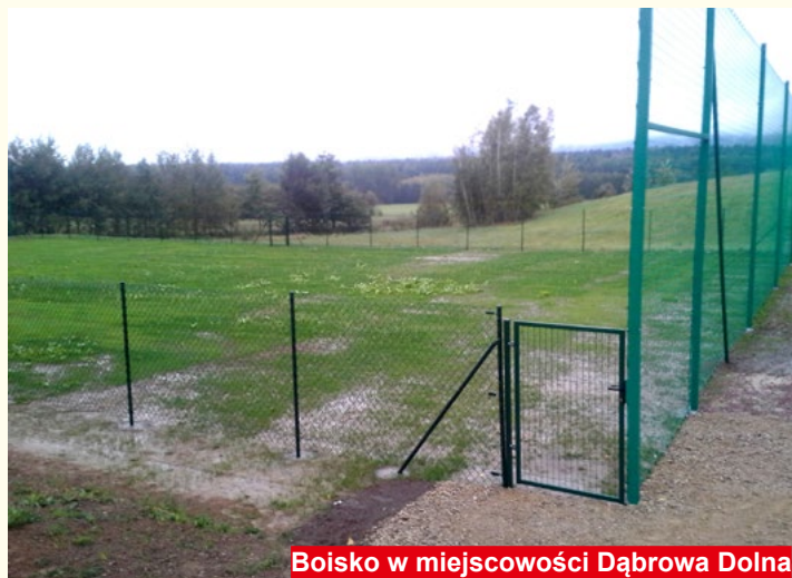
Boisko w miejscowości Dąbrowa Dolna

Jestem zwolennikiem ścisłej współpracy z samorządami na szczeblu powiatowym i wojewódzkim oraz współpracy z Wojewodą. W przypadku powiatu są wyraźne przykłady dobrej współpracy. Mam na myśli współfinansowanie w 50% inwestycji drogowych na drogach powiatowych. Strategiczną inwestycją jest przebudowa dróg wojewódzkich 751, 752