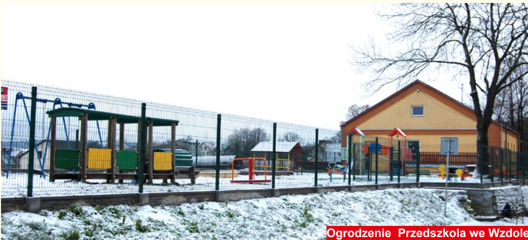
Ogrodzenie Przedszkola we Wzdole

Łączna wartość tych inwestycji wynosi: 2 097 412,73 zł