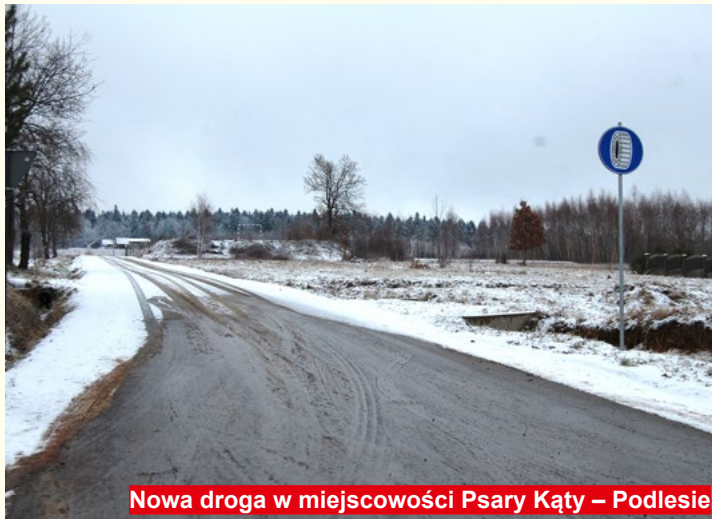
Nowa droga w miejscowości Psary Kąty – Podlesie

- Gmina realizuje projekt złożony przez Fundację Centrum Europy Lokalnej, gdzie Gmina Bodzentyń występuje jako partner. Projekt realizowany jest w ramach RPOWŚ 2014-2020 Działania „Zwiększenie dostępu do wysokiej jakości edukacji przedszkolnej oraz kształcenia podstawowego, gimnazjalnego i ponadgimnazjalnego”. Projekt pn. „Klucz do lepszej edukacji – wsparcie