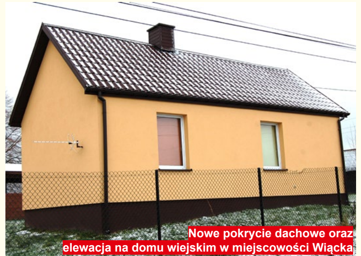
Nowe pokrycie dachowe oraz elewacja na domu wiejskim w miejscowości Wiącka

- Po objęciu stanowiska Burmistrza zastałem zadłużenie w kwocie blisko 18 mln zł oraz około 0,5 mln zobowiązań wymagalnych. Obecnie zadłużenie spadło do kwoty około 15,5 mln zł. Ogólnie rzecz biorąc sytuacja finansowa naszej gminy nie jest wesoła. Aby myśleć o realizacji inwestycji na terenie naszej gminy podjąłem zdecydowaną decyzję o konsolidacji zadłużenia i wydłużeniu czasu spłat kredytu, który był w kilku bankach. W ten sposób zostało uwolnione około 2 mln zł na bieżące potrzeby naszych mieszkańców. Środki te muszą pozwolić nam na wkłady własne do planowanych projektów oraz do zabezpieczenia utrzy-