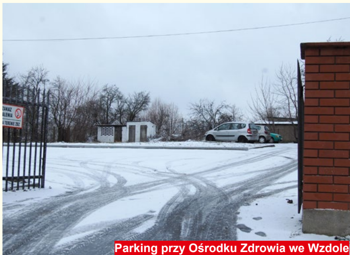
Parking przy Ośrodku Zdrowia we Wzdole

- Kolejny projekt, którego Gmina Bodzentyń jest partnerem, zaś wnioskodawcą Fundacja Rozwoju Demokracji Lokalnej, złożony został do Poddziałania 9.2.1 „Rozwój wysokiej jakości usług społecznych” RPOWŚ i dotyczy