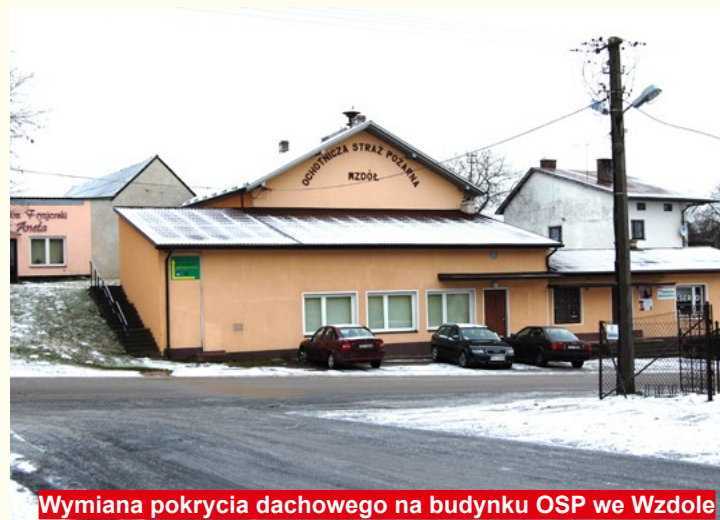
Wymiana pokrycia dachowego na budynku OSP we Wzdole

czalni w miejscowości Grabowa, którą można sfinansować dzięki pożyczkom z WFOŚ i w większości dzięki środkom własnym.