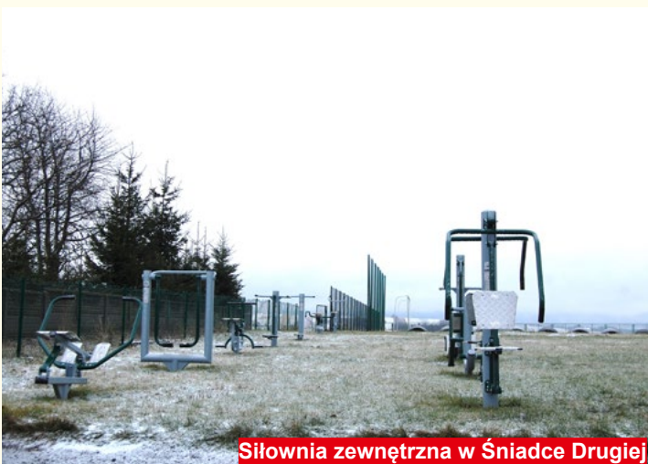
Siłownia zewnętrzna w Śniadce Drugiej

Do takich śmiałych inwestycji na pewno trzeba zaliczyć gospodarkę wodno-ściekową. Obecnie przygotowujemy jest wniosek, który zostanie złożony do 28 lutego 2017r. na robotę budowę oczyszczalni ścieków w Bodzentynie oraz budowę około 80 km sieci kanalizacyjnej w 17 miejscowościach w naszej gminie, które kwalifikują się do kryteriów zawartych w programie (Dąbrowa Górna, Dąbrowa Dolna, Śniadka Pierwsza, Śniadka Druga, Śniadka Trzecia, Sieradowice Pierwsze, Sieradowice Drugie, Leśna Stara Wieś, Podkonarze, Kamienna Góra, Parcelanci, Wzdół Kolonia, Wiącka, Stara Wieś, Wzdół Rządowy, Hucisko, Psary Podłazy), wraz z budową trzech studni rezerwowych tj. Wzdół oraz Bodzentyn: ul. Suchedniowska