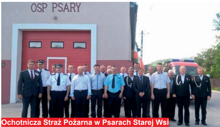
Ochotnicza Straż Pożarna w Psarach Starej Wsi