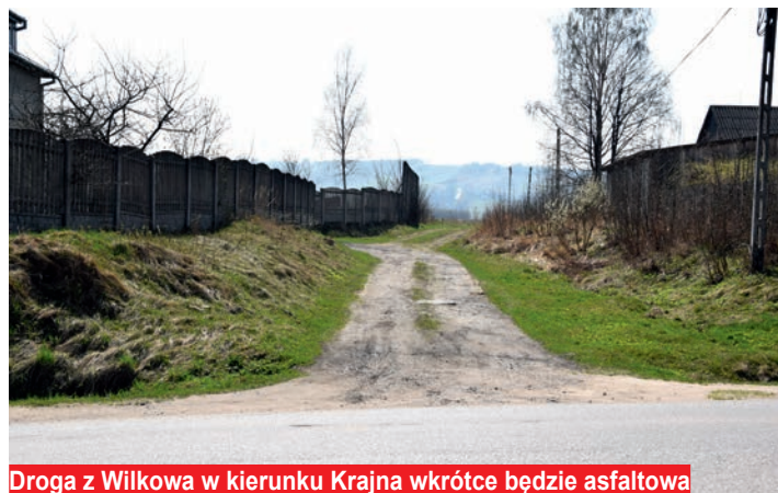
Droga z Wilkowa w kierunku Krajna wkrótce będzie asfaltowa

Ze względu na odpowiednio przygotowany wniosek, Gmina Bodzentyn środki na przebudowę drogi Wilków - Krajno Zagórze pozyskała bezpośrednio po złożeniu i weryfikacji wniosku przez komisję: - Pieniądze z rządowego programu chciała pozyskać także Gmina Górno na realizację zadania pn. „Przebudowa drogi gminnej Krajno -Parcele – Krajno Pogorzele – Wilków w miejscowości Krajno Zagórze”. Niestety, wniosek z powodu niespełnienia wymogów formalnych dwukrotnie został odrzucony przez komisję. Warunkiem połączenia Wilkowa z Krajnem jest wykonanie przez