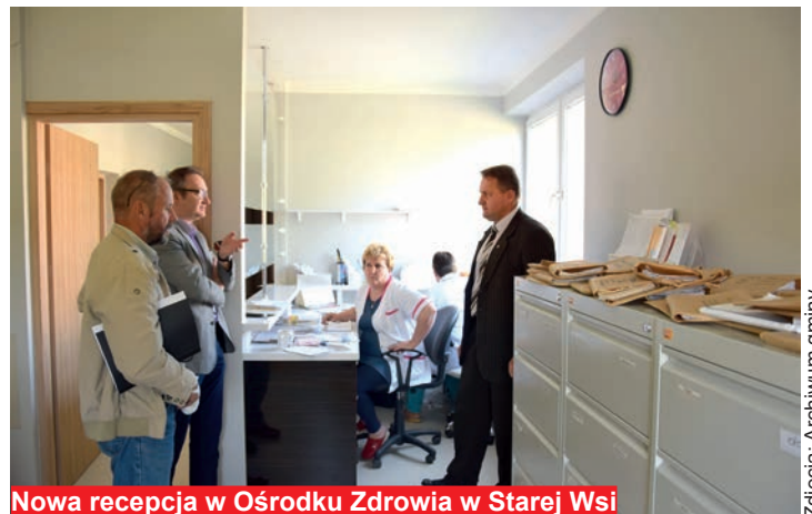
Nowa recepcja w Ośrodku Zdrowia w Starej Wsi