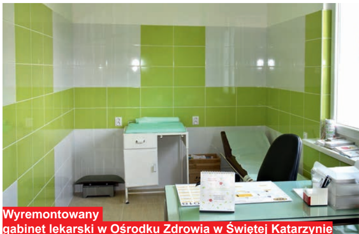
Wyremontowany gabinet lekarski w Ośrodku Zdrowia w Świętej Katarzynie