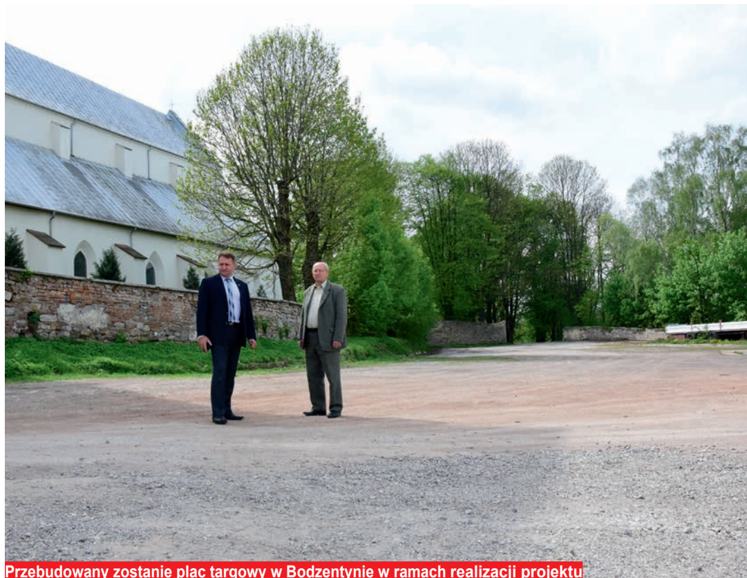
Przebudowany zostanie plac targowy w Bodzenty w ramach realizacji projektu