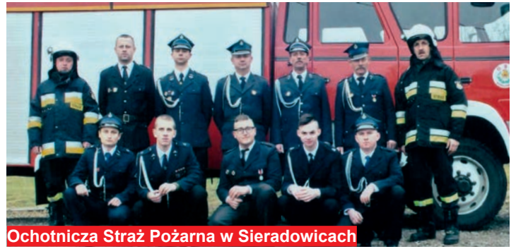
Ochotnicza Straż Pożarna w Sieradowicach

O druhów z Sieradowic dba nie tylko samorząd gminny, ale i mieszkańcy sołectwa. W ramach funduszy sołeckich z budżetu gminnego ocieplono budynek remizy, a także wyłożono taras płytkami. Dodatkowo wyremontowano garaż Ochotniczej Straży Pożarnej oraz wykonano instalację grzewczą w remizie. - Współpraca z samorządem gminnym układa się bardzo dobrze. Gdy były potrzebne koła do samochodu, samorząd gminny od razu zakupił. Samochód jest używany, a koła były, jak to się mówi, w ładnym stanie na oko, ale miały już kilkadziesiąt lat, co jest niezwykle