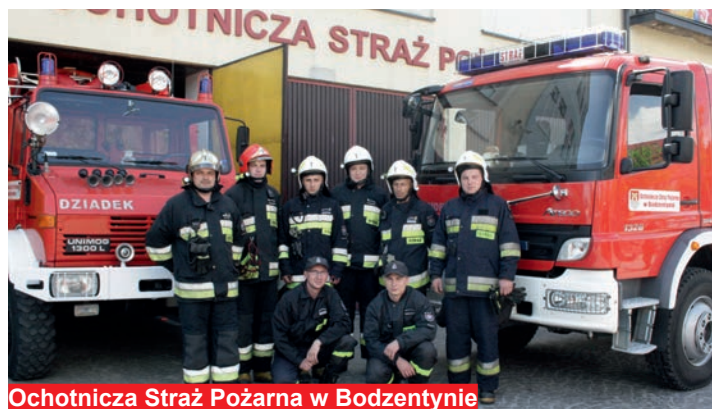
Ochotnicza Straż Pożarna w Bodzentynie