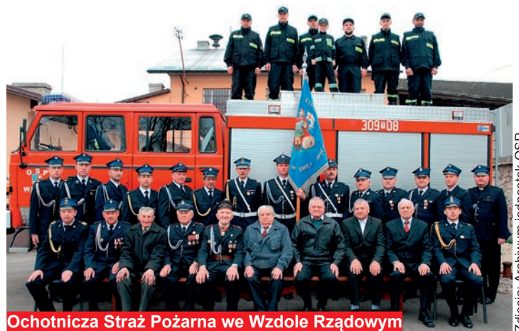
Ochotnicza Straż Pożarna we Wzdole Rządowym