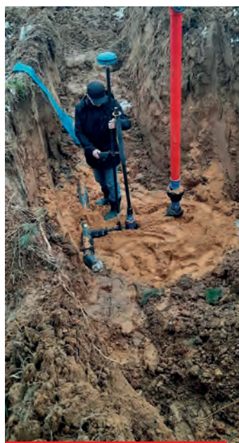
Inwentaryzacja geodezyjna w wykopie - montaż nowego hydrantu Podkonarze.

Na uwagę zasługuje rozpoczęcie w lutym 2022 roku oczekiwanej przez mieszkańców przebudowy istniejącej sieci wodociągowej w Bodzentynie