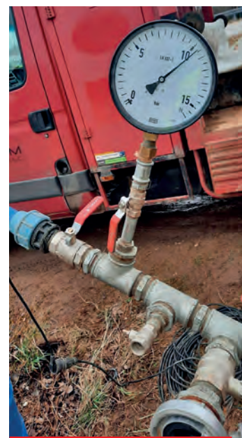
Próba szczelności wodociągu Podkonarze, Bodzentyn, ul. Wolności.

PAMIĘTAJ, ZŁÓŻ DEKLARACJĘ o źródłach ogrzewania budynków